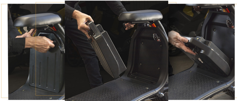
Batería de litio extraíble.

Cualquiera de las dos opciones es extraíble y posee hasta 800 ciclos de carga.